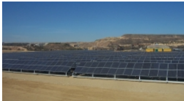
Huerto Solar de Aznalcollar, Sevilla

De los primeros proyectos piloto destacamos las instalaciones realizadas en Sierra María, Almería (160 kWp).