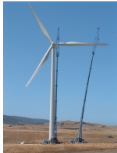
Parque Eólico La Herrería. Tarifa, Cádiz

Perspectivas a Medio/Largo plazo (hasta el 2010): El PLEAN prevé 4.000 MW instalados.