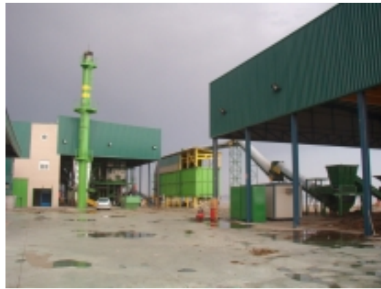
Planta de Gasificación de Nijar, Almería

Perspectivas a Medio/Largo plazo (hasta el 2010): El objetivo del PLEAN es lograr en 2010 una potencia instalada de biomasa de 250 MW.