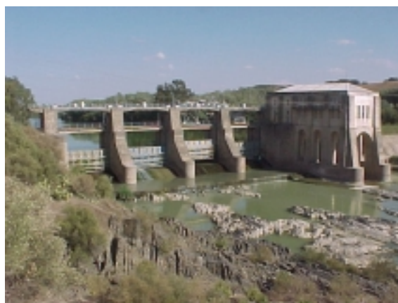
Presa de Villafranca. Córdoba.

Presente: En Andalucía la demanda de agua para riego y agua potable es prioritaria frente a usos energéticos. Esta situación hace que el desarrollo futuro de la energía hidroeléctrica se vea muy condicionado y limitado al