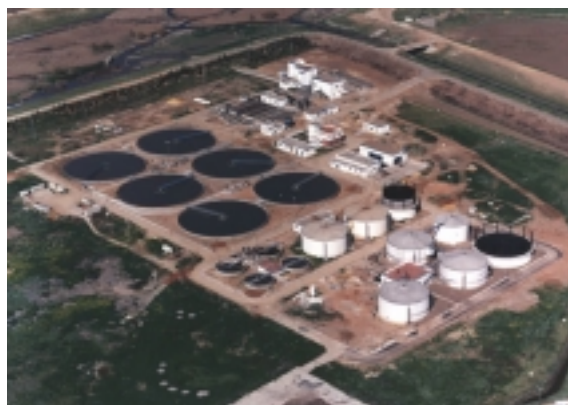
Estación Depuradora Copero, Sevilla

En años anteriores se han realizado varias instalaciones de aprovechamiento de biogás de Residuos Ganaderos (principalmente de