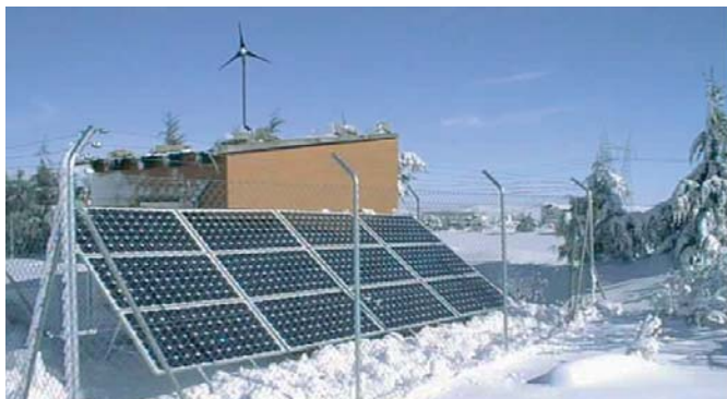
Instalación eólico-fotovoltaica aislada

Dichos costes deberán compararse directamente con la inversión de la instalación solar fotovoltaica y su mantenimiento durante la vida útil de la misma.