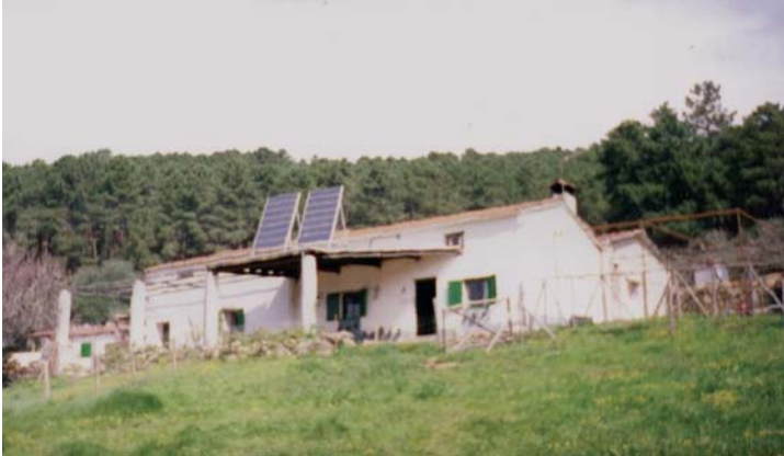
Módulos solares fotovoltaicos

Así, si lo que se desea es electrificar una vivienda, la premisa de la instalación es el aseguramiento del suministro, esto es, que la instalación solar proporcione energía en el período de mayor demanda. Ello conlleva, generalmente, a que la demanda se produzca en invierno (mayor número de horas de utilización en la iluminación), que es el periodo en el que menor radiación solar se dispone.