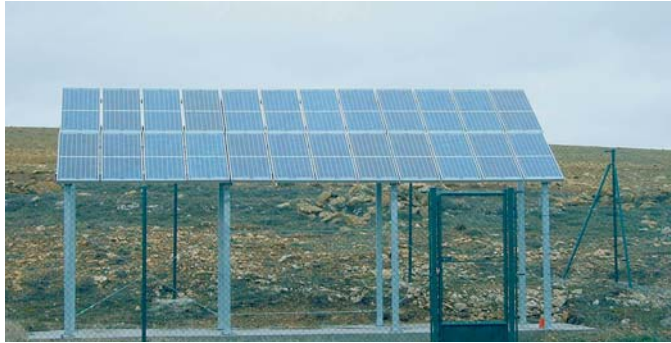
Instalación fotovoltaica aislada para riego

Así por ejemplo, el bombeo de agua para riego permite que cuando mayor producción se pueda obtener de los módulos fotovoltaicos (verano) es cuando mayor calor hace y, por tanto, cuando más necesidad se tiene de regar.