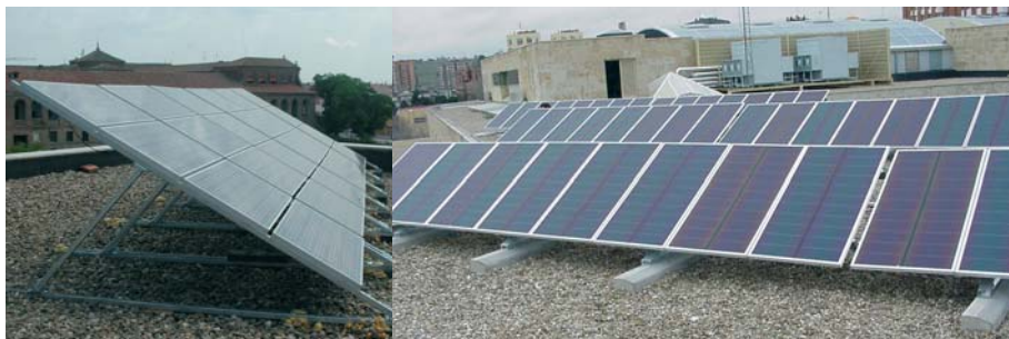
Instalaciones solares fotovoltaicas conectadas a red

Evidentemente, en los valores de referencia anteriores no se ha tenido en cuenta la evolución de los precios de los combustibles con el paso del tiempo, si bien su incremento anual futuro es más que probable.