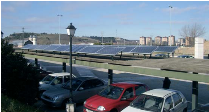
Módulos solares fotovoltaicos

La energía solar se encuentra presente en nuestras vidas en numerosas aplicaciones, calculadoras solares, señales viales, satélites, etc., por lo que no deberíamos desconfiar de su utilización.