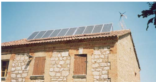
Instalación eólico fotovoltaica aislada para electrificación de vivienda

Así, cualquier utilización de estos sistemas alejada de sus márgenes de funcionamiento, solo logrará acelerar el envejecimiento de la instalación, su mal funcionamiento o rotura.