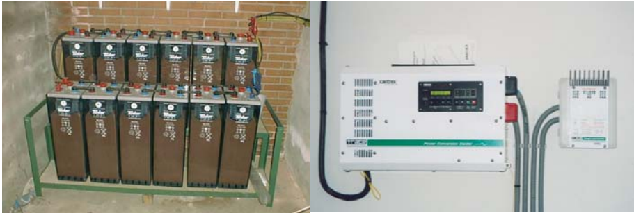
Acumuladores eléctricos y equipos electrónicos de una instalación fotovoltaica aislada

El elemento clave de la instalación solar, a excepción del panel solar, es el acumulador, equipo que guarda la energía producida por los paneles para que sea utilizada cuando el consumidor la necesite. La cantidad de energía que ha de almacenarse depende de las horas de diferencia que existe desde que se genera en los módulos hasta que es consumida por el usuario y el grado de seguridad que se desee para la cobertura aportada por el sistema solar.