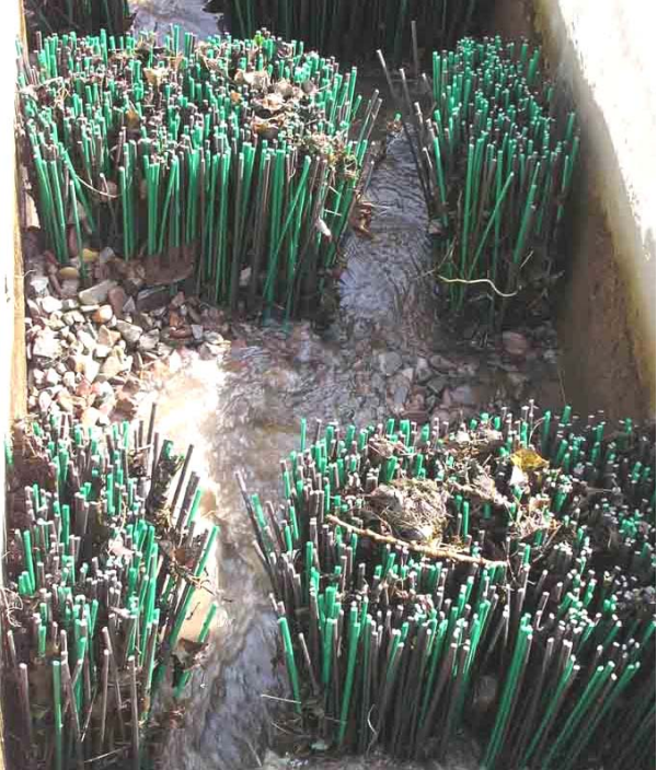
Borstenfischpass ohne Dotation. In den Borsten bleibt leicht Geschwemmsel und Laub hängen.