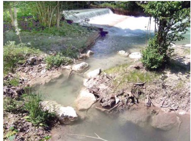
Ideale Mündung eines Tümpelpasses unmittelbar unterhalb des Wehres in den Wehrkolk. Die Fische können diese Aufstiegshilfe problemlos auffinden.