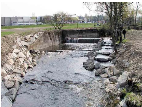
Eine Mündung der Fischwanderhilfe weit unterhalb des Wehres ist ungünstig, da die Auffindbarkeit durch die Fische erschwert ist.