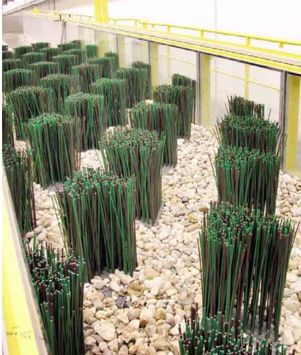
Borstenfischpass – Modellanlage in einer Versuchshalle der Universität Kassel.