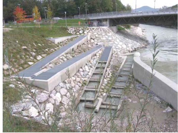
Mit einem Vertical-Slot-Pass kann auf engem Raum eine große Höhendifferenz überwunden werden.