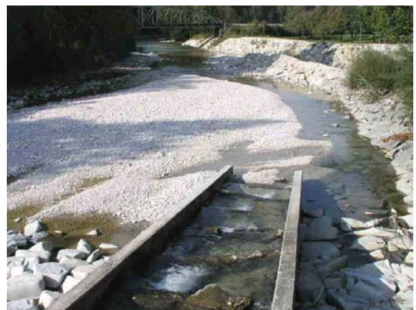
Diese Fischwanderhilfe mündet im Flachwasserbereich und ist daher für Fische nur schwer auffindbar und passierbar.