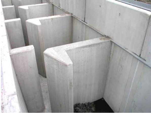
Vertical-Slot-Pass in der Bauphase, ohne Dotation.