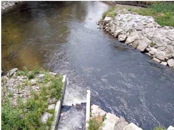
Optimalerweise mündet eine Fischwanderhilfe direkt unterhalb des Wehres bzw. wie hier beim Turbinenauslauf.

Besonders wichtig ist die Lage des Einstieges einer FWH (Mündung ins Unterwasser), da diese die Auffindbarkeit durch die Fische bestimmt. Der Einstieg muss so situiert sein, dass die Masse der Fische "automatisch" hineinfließt und liegt optimalerweise am Prallhang in der Nähe des Turbinenauslaufs. Das Wasser aus der FWH bildet eine Leitströmung (Lockströmung), die auf die Wanderroute der Fische trifft und diese in die Aufstiegsanlage leitet.